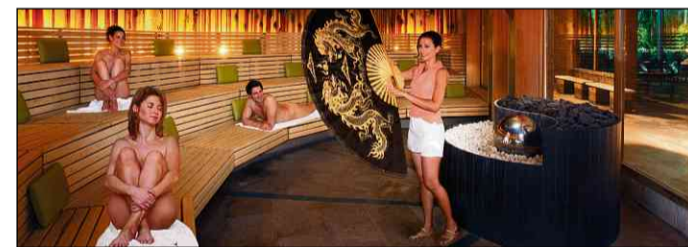
Da werden die Sinne wach: entspannende Musik, es duftet und die Kühle auf der Haut tut gut

Bei der langen Thermenwelt-Nacht am 19. November ist den Erholungssuchenden eine Vielzahl an Highlights geboten: Meditative Sinnesreisen in der Alhambra des Saunaparadieses schicken auf eine ungeahnte Entdeckungsreise. Frisch gebackenes Sinneskonfekt sowie mehrmals täglich stattfin-